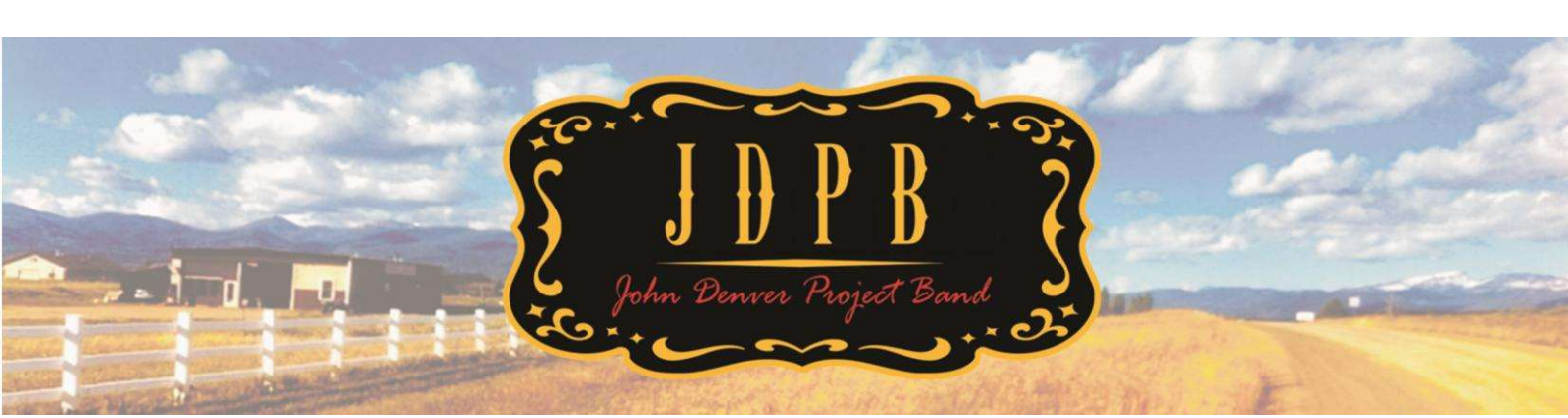
Photo Gallery - TAKE ME HOME COUNTRY ROADS tribute to John Denver